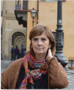
Profesora Universidad de Deusto

nuestras estructuras sociales no están preparadas para abordar los conceptos de dignidad y autonomía en los adultos mayores. Finalizó invitando a reconocer la dignidad y la autonomía como derechos incuestionables.