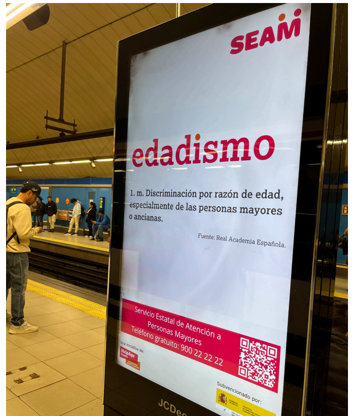
Campana SEAM / HelpAge International España

En conjunto, estas acciones han contribuido a dar mayor visibilidad a los derechos de las personas mayores, impulsar cambios en normas y reforzar la colaboración tanto a nivel nacional como internacional.