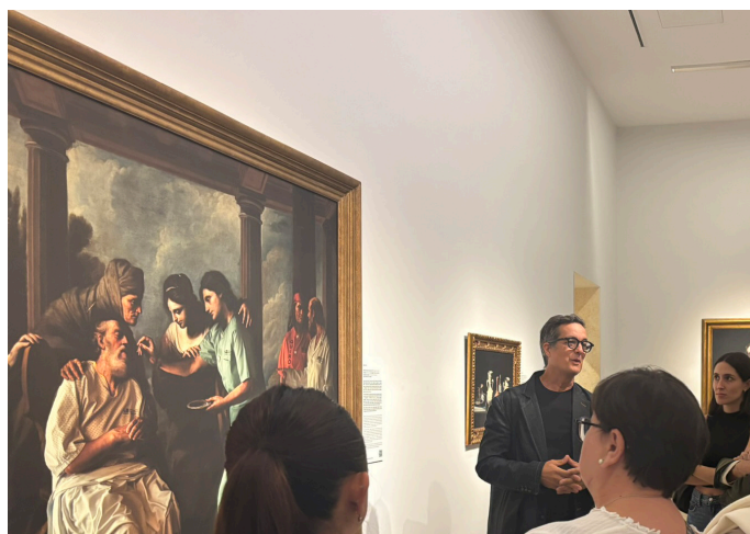
Exposición “Arte y Salud” en el Museo Thyssen-Bornemisza / HelpAge International España

Celebrado en Valencia (23–24 octubre), este congreso reunió a juristas, profesionales del derecho, activistas y responsables institucionales para analizar el acceso a la justicia de las personas mayores. Se debatieron discriminaciones estructurales en los ámbitos penal, civil y administrativo, y se propusieron reformas legales y buenas prácticas para garantizar la igualdad ante la ley en todas las etapas de la vida.