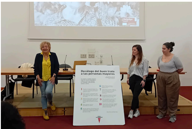
Formaciones al Ayuntamiento de Rivas-Vaciamadrid / HelpAge International España

En 2025, nuestras campañas han combinado testimonios reales, enfoques pedagógicos y una estrategia comunicativa creativa para generar impacto y promover cambios sociales.