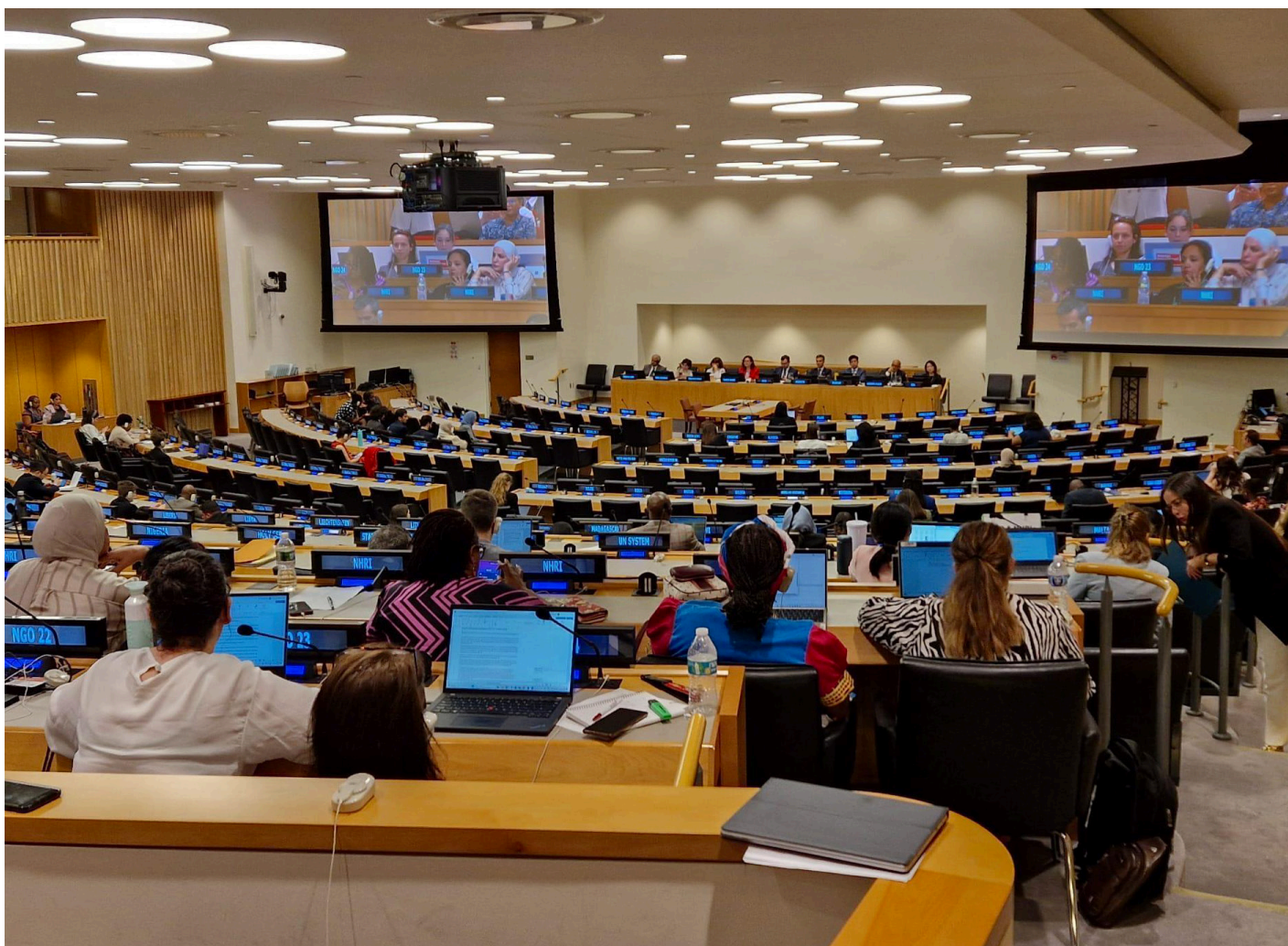
Equipo técnico en Naciones Unidas / HelpAge International España

Este conjunto de acciones ha contribuido a reforzar el reconocimiento de la necesidad de un instrumento internacional específico, avanzando en la sensibilización institucional y social sobre los derechos de las personas mayores como derechos humanos.