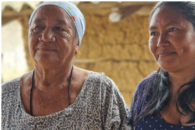
Colombia / HelpAge International España