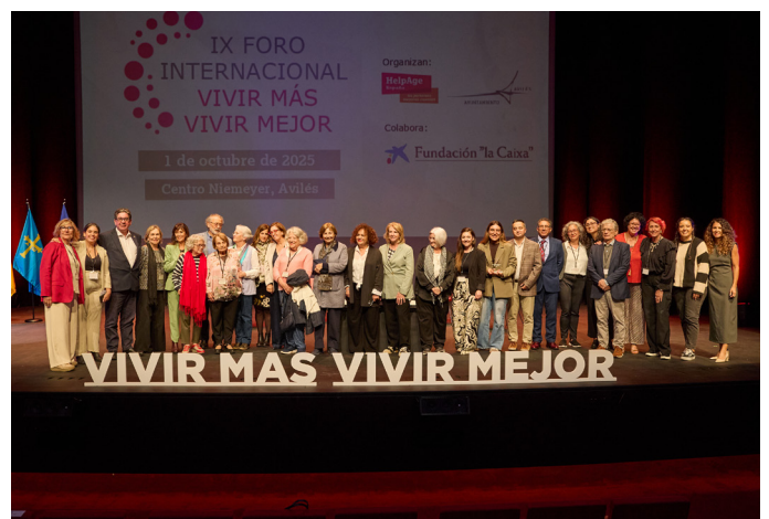
IX Foro “Vivir Más, Vivir Mejor” / HelpAge International España

Es el cuarto informe de la colección “Los derechos humanos de las personas mayores en España: igualdad y no discriminación por edad”. Analiza el impacto del edadismo en derechos como honor, intimidad, protección de datos e inviolabilidad del domicilio. Examina vulneraciones en cuidados sociosanitarios, residencias, tecnologías y entornos familiares, e incluye cuestiones como la sexualidad en la vejez, proponiendo recomendaciones dirigidas a administraciones y sociedad para reforzar la protección efectiva de estos derechos.