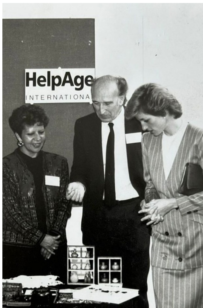
Fundadores y Princesa Diana

Somos parte de un movimiento global que trabaja para que todas las personas puedan envejecer con dignidad, en cualquier lugar del mundo.