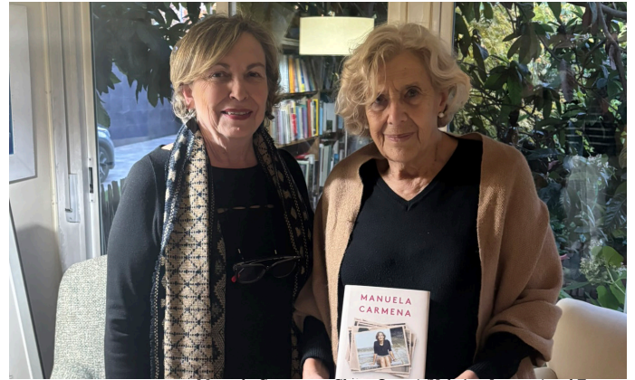
Manuela Carmena y Charo Otegui /HelpAge International España

desarrollo de investigaciones, la evaluación de leyes y políticas públicas, así como la promoción de actividades educativas orientadas a mejorar la empatía social y desmontar estereotipos y creencias erróneas sobre las personas mayores y sus derechos.