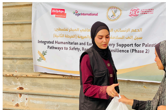
Ayuda en Gaza

A pesar de los enormes desafíos — desplazamiento, pérdida de redes familiares y deterioro de la salud—, las personas mayores siguen desempeñando un papel clave en el sostenimiento de sus comunidades.