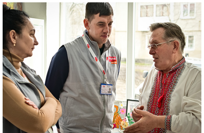
Emergencia Humanitaria Ucrania

Impulsamos una cooperación que reconoce a las personas mayores como protagonistas del cambio en sus comunidades.