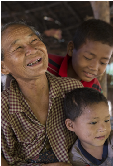
HelpAge International España

Contamos con auditoría externa anual, realizada por una entidad independiente, así como con sistemas internos de control y mejora continua que incluyen mecanismos de evaluación participativa en nuestros programas. Asimismo, publicamos de forma periódica nuestra información institucional y financiera en la web, en línea con los principios del Código de Conducta de la Coordinadora de ONGD y la normativa vigente en materia de transparencia.