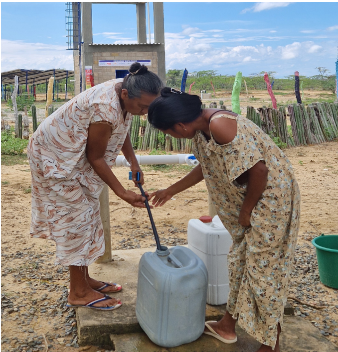
Proyecto WASH en Colombia