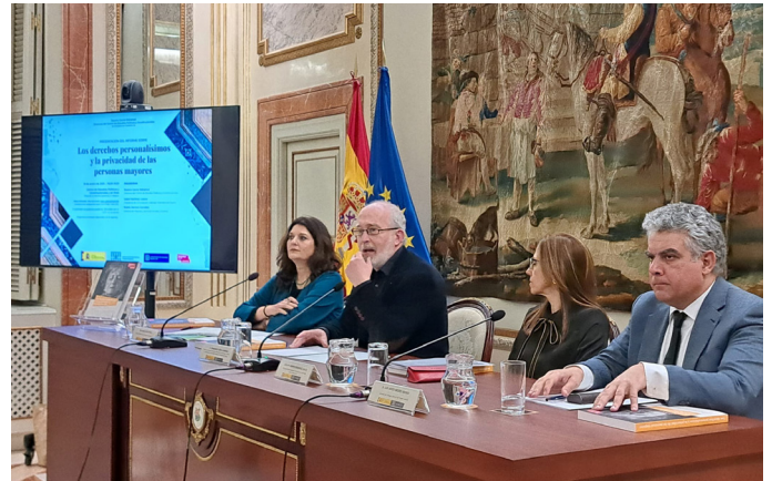
Formaciones al Ayuntamiento de Rivas-Vaciamadrid / HelpAge International España

el análisis de las principales problemáticas y necesidades que afectan a este colectivo en el ejercicio de sus derechos. El informe pone de relieve las barreras y dificultades que enfrentan las personas mayores en el acceso a recursos y servicios, al tiempo que subraya la necesidad de adoptar un enfoque integral, basado en derechos, que garantice su bienestar, autonomía y protección.